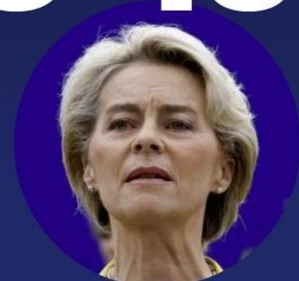
Ursula von der Leyen