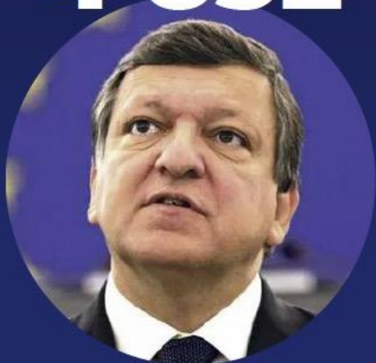
José Manuel Barroso